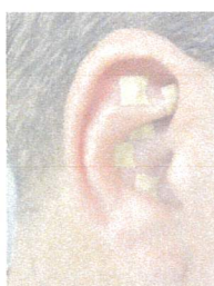
NADA kann sowohl mit Nadeln als auch mit Pflastern angewendet werden

Nimm dir am besten ca 1 1/2 Stunden Zeit, damit du wirklich stressfrei in und auch aus der Behandlung gehst. Die Behandlung selbst dauert in etwa 45 Minuten. Dazu